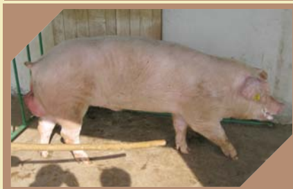
NINBUS K - 343 N/N

Pasma: Njemački landras Rođen: 10.07.2008. Zemlja podrijetla: NJEMAČKA BLUP: 143 Veličina legla: 11-9,5