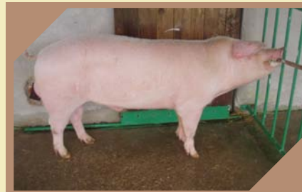
MAXIMUS K - 333 N/N

Pasma: Njemački landras Rođen: 02.01.2007. Zemlja podrijetla: NJEMAČKA BLUP: 168 Veličina legla: 38-11,5