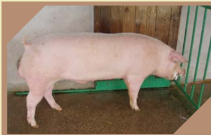
BAKUS K - 330 N/N

Pasma: Njemački landras Rođen: 22.01.2007. Zemlja podrijetla: NJEMAČKA BLUP: 134 Veličina legla: 44-10,8