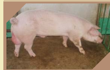
ZEUS K - 356 N/N

Pasma: Njemački landras Rođen: 07.11.2008. Zemlja podrijetla: NJEMAČKA BLUP: 136 Veličina legla: 8-11,1