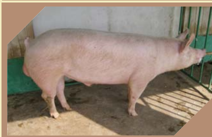
ADONIS K - 345 N/N

Pasma: Njemački landras Rođen: 30.05.2008. Zemlja podrijetla: NJEMAČKA BLUP: 160 Veličina legla: 14-10,6